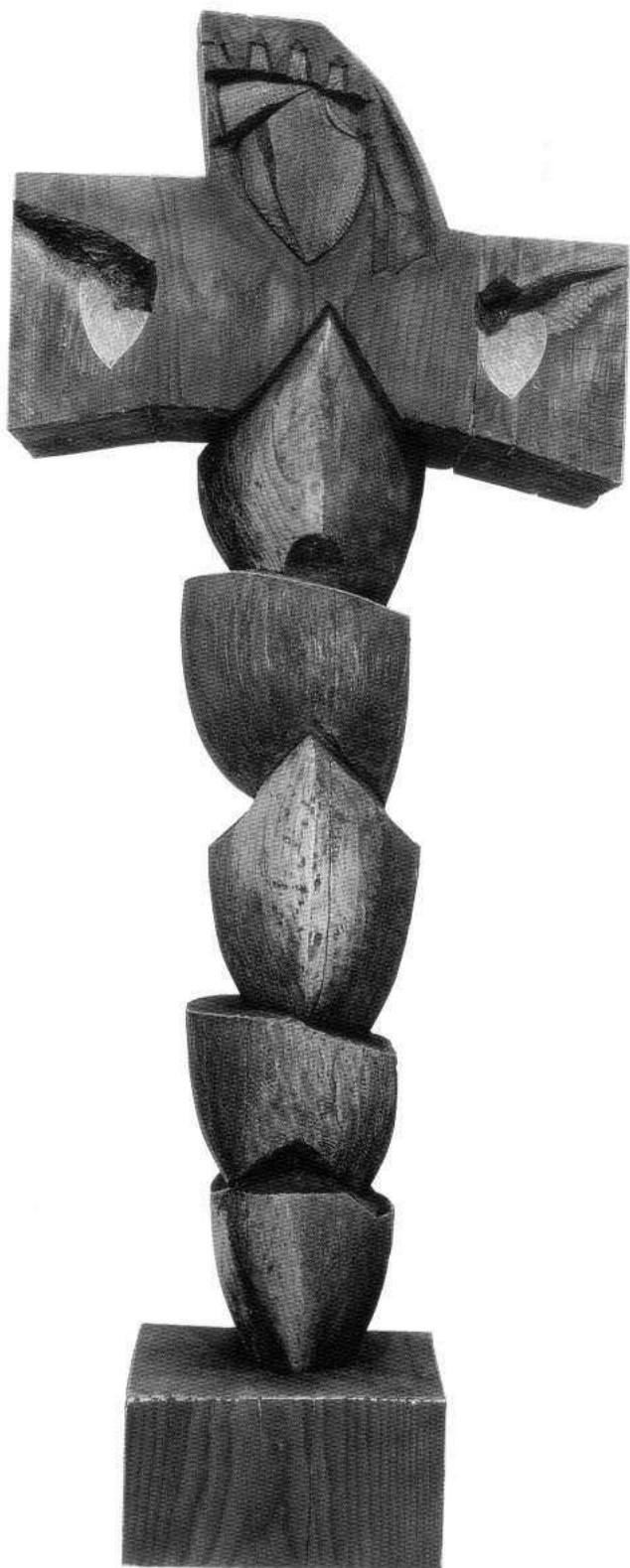
Hosana sinu Davidovu – Šime Vulas: Raspelo , 2015.