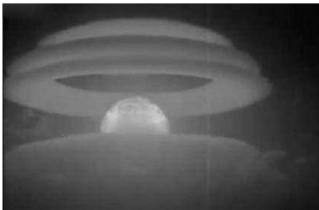
EMP, elektromagnetski puls.

Isus je rekao: "Moj narode, uz mušku povijest đakona i svećenika, teško je zamisliti takvu promjenu u tradiciji da se žene uzmu u obzir kao đakoni što bi moglo čak spomenuti mogućnost žena kao svećenika. Moje apostole sam učinio prvim svećenicima i đakoni su bili najvećim djelom izabrani među muškarcima. Da sam želio da žene budu svećenici i đakoni, Ja sam tako mogao napraviti, ali muškarci sada žive životom celibata u Mojoj službi. Mijenjanje takve tradicije bilo bi teško nakon toliko puno godina. Ako žene trebaju postati đakoni, to bi trebala biti odluka Duha Svetoga."