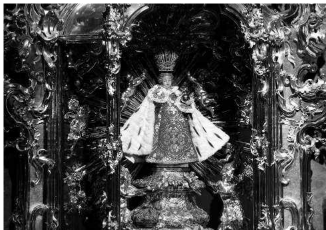
Praški mali Isus