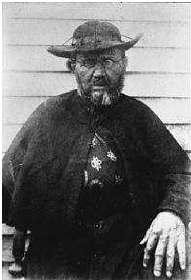
Sveti Damjan de Veuster